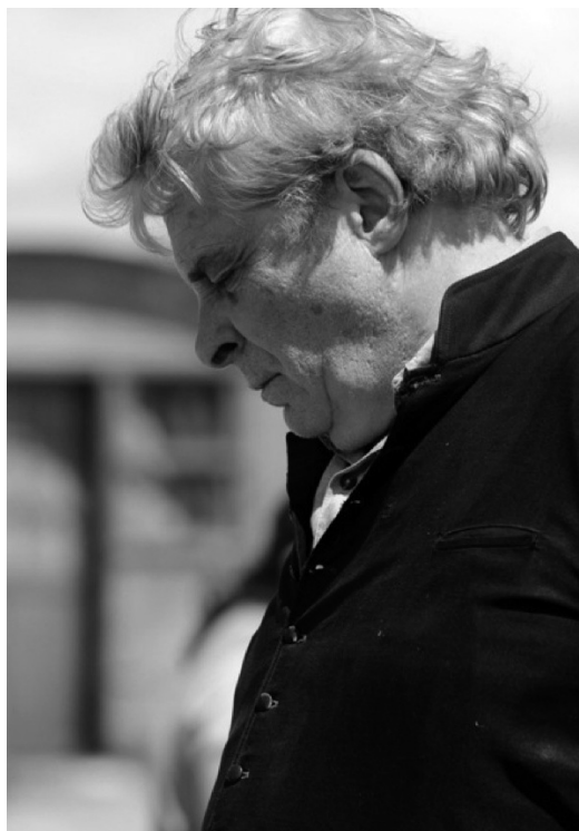
Jacques Weber speelt Joseph Wresinski

De film ontleent zijn kracht ook aan de onwaarschijnlijke samenwerking tussen professionele acteurs en gelegenheidsspelers, ook jongeren en kinderen, die zelf in hun leven armoede hebben meegemaakt. Dit maakt de film nog realistischer, omdat de inbreng van deze mensen werd gebruikt om de dialogen en scènes te versterken.