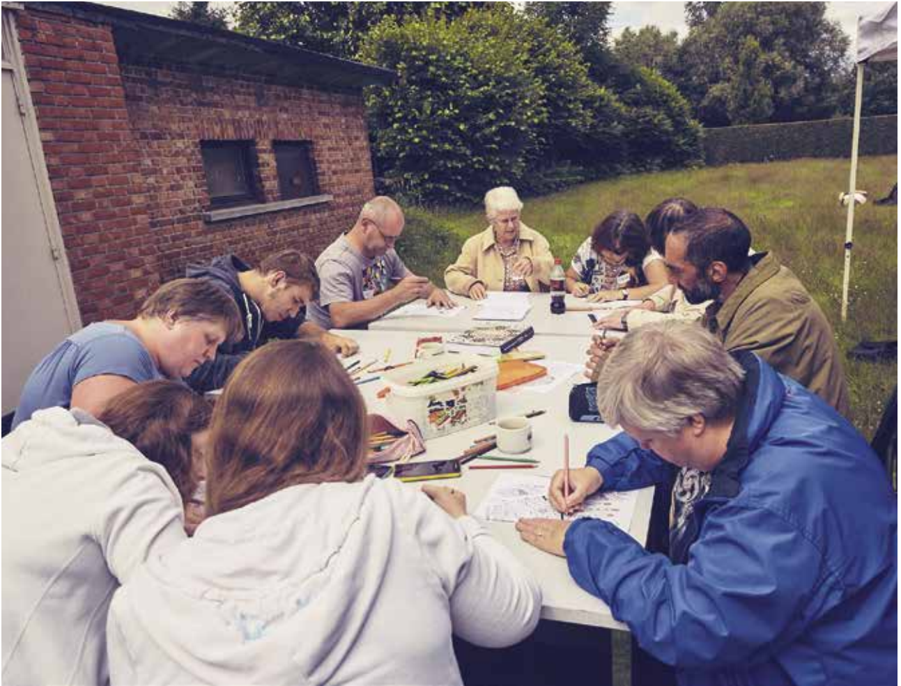
Creatief atelier tijdens de Volksuniversiteit van juli 2016. ▲

te worden, het laat hen op adem komen. Ook al is de opera soms moeilijk te volgen (het is vaak in het Italiaans, Duits,...), toch genieten mensen in armoede hiervan. Samen naar een voorstelling gaan is een sociaal gebeuren, mensen vinden het leuk om bij elkaar te zijn en uit hun isolement te treden. Tenslotte zorgen deze uitstappen voor een moment van ontmoeting en dieper contact. Zowel voor, tijdens als na de voorstellingen vertellen mensen over alles en nog wat, waar je anders helemaal geen weet van hebt. Je leert elkaar op een andere manier kennen.