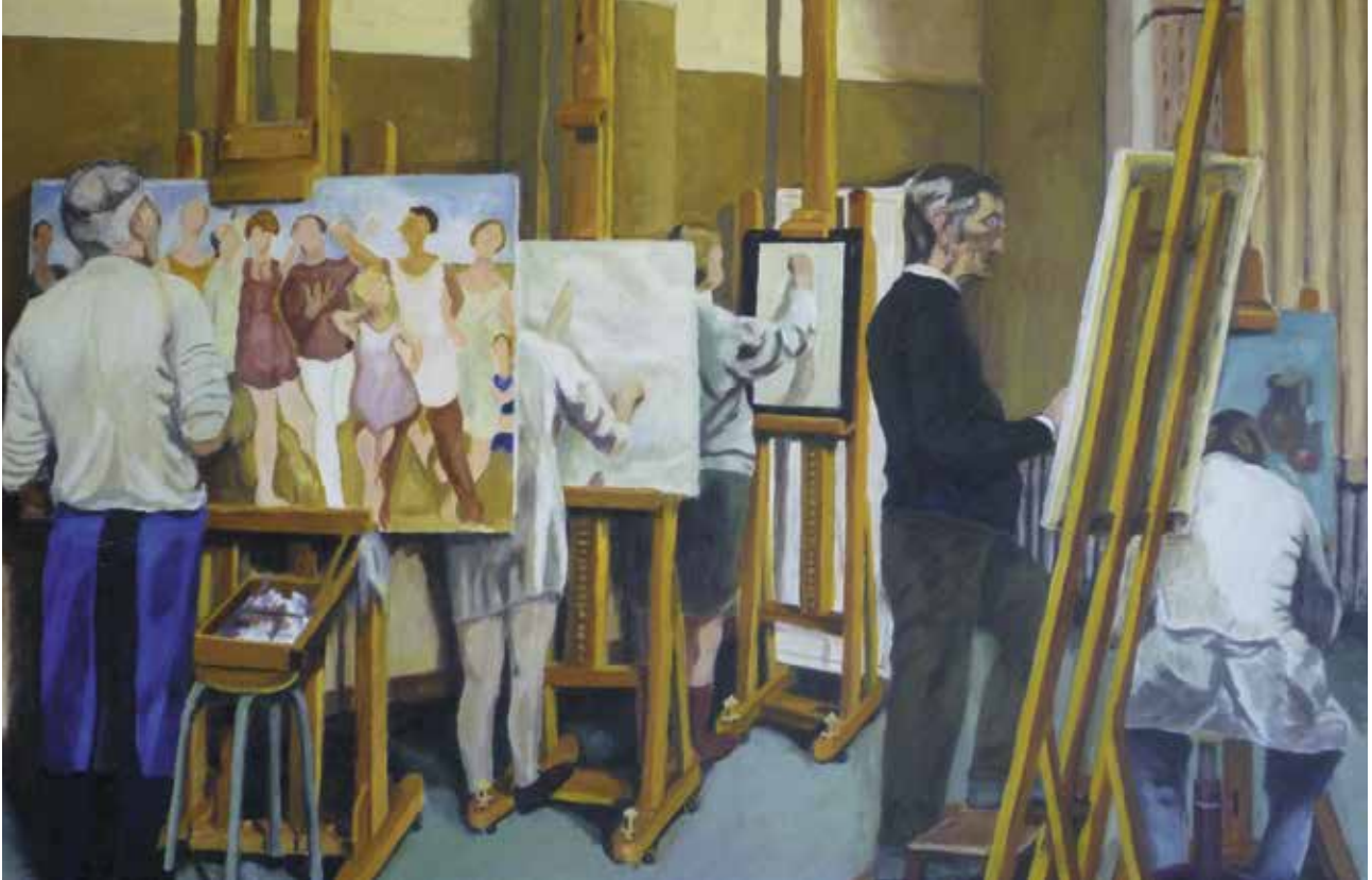
Schilderij door Jan Bulens ▲