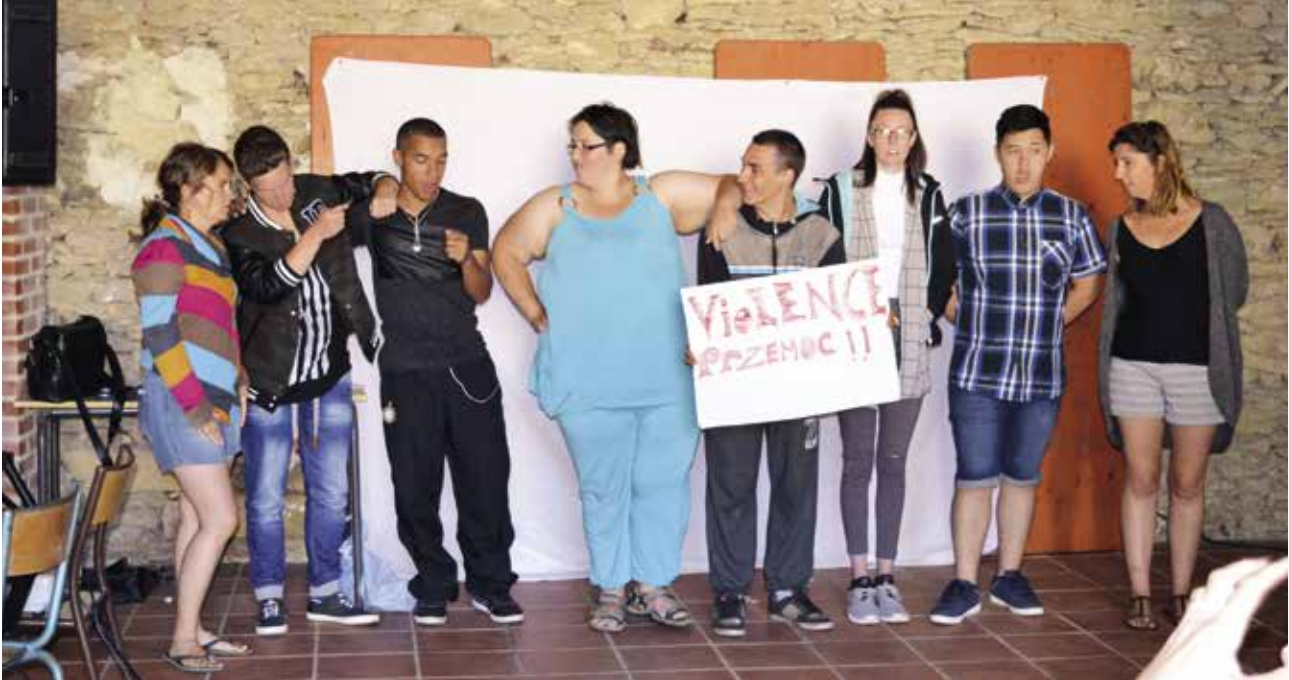
35 jongeren uit 5 verschillende landen namen deel aan de jongerenbijeenkomst in Frankrijk ▲